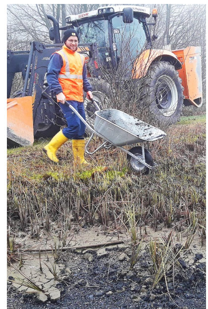
Ein vielfältiges und abwechslungsreiches Tätigkeitsfeld wird im Gemeindebauhof geboten.