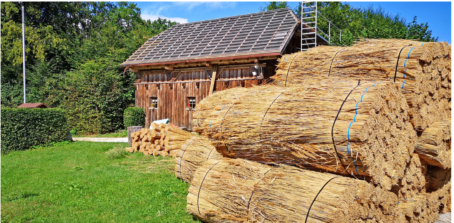
Der Naturparkstadl beim Großdöllnerhof wurde in den vergangenen zwei Wochen mit frischem Schilf vom Neusiedlersee eingedeckt.