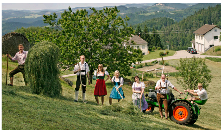
Die Jungen Thominger haben schon eifrig bei einem Sensenmähkurs trainiert und gelten als Favoriten

Die Besucher gewinnen Einblick in die alte Handwerkstechnik des Sensenmähens und Dengelns, wie früher Heu gemacht wurde und mit welchen Geräten gemäht wurde. Zum Mitmachen beim Sensenmähwettbewerb sind Mäher aus allen vier Naturparkgemeinden herzlich eingeladen. Anmeldung für den Wettbewerb telefonisch im Naturparkbüro: 07264/4655 DW 18 od. 25.