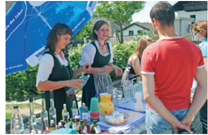
Für die Besucher des Schmankerl-Kirtages stand „Genuss pur“ auf dem Programm.

Die ARGE Nahversorgung und der Wirtschaftsbund kündigten bereits jetzt an, den Schmankerl-Kirtag aufgrund vieler positiver Reaktionen auch 2012 wieder zu veranstalten. Auch dann kann die Küche in den Rechberger Haushalten wieder kalt bleiben – sofern es nicht regnet.