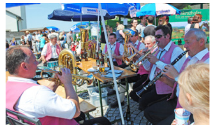
„Genuss pur“ unter Begleitung der Rechberger Trachtenmusikkapelle.