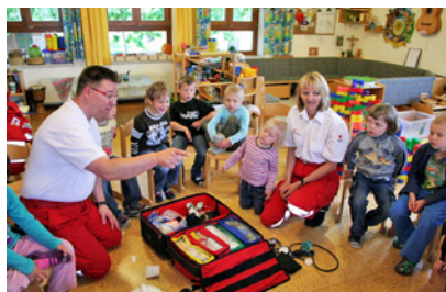
Für die Kinder war es besonders spannend, den Erklärungen der Sanitäter zuzuhören.