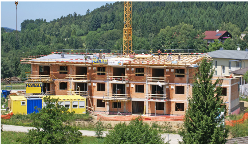
Die Dachgleiche wurde gebührend gefeiert. Mittlerweile sind bereits die Installationsfirmen am Werk.

Am 09. Juni fand die Feier der Dachgleiche bei den neuen GWB Wohnbauten statt. Aufgrund einer perfekten Witterung im Winter und Frühjahr liegt man exakt im Zeitplan. Wenn Sie noch Interesse an einer Wohnung haben, können Sie sich gerne am Gemeindeamt informieren. Derzeit sind noch bestimmte Wohnungen frei. Viele Veranstaltungen prägen auch heuer wieder das Rechberger Ortsleben. Ich bedanke mich schon jetzt bei den vielen Helferinnen und Helfern für die aktive Mitarbeit. Besonders einladen möchte ich auch zum Mähfest des Naturparkvereins am 17. Juli von 11-16 Uhr in St. Thomas am Bl.