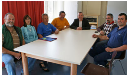
Bürgermeister und Vizebürgermeister besuchten das Bauhofteam im neuen Sozialraum